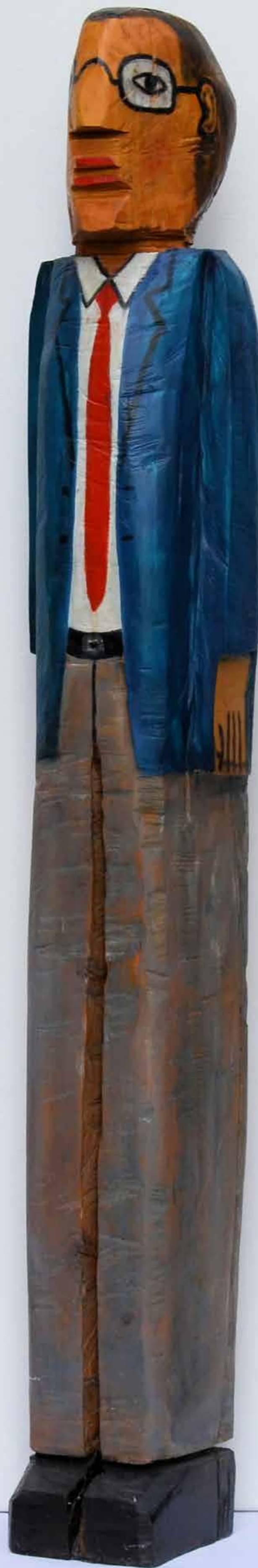
HABE NIX (links), 2011, Holzskulptur bemalt, ca. 106 cm hoch; HABE DANK (rechts), 2011, Holzskulptur bemalt, ca. 126 cm hoch | Peter Kunkel Art | www.mhb-gruppe.de | Kunst in Ihren Räumen - Exklusive Kunst zum Mieten und Kaufen