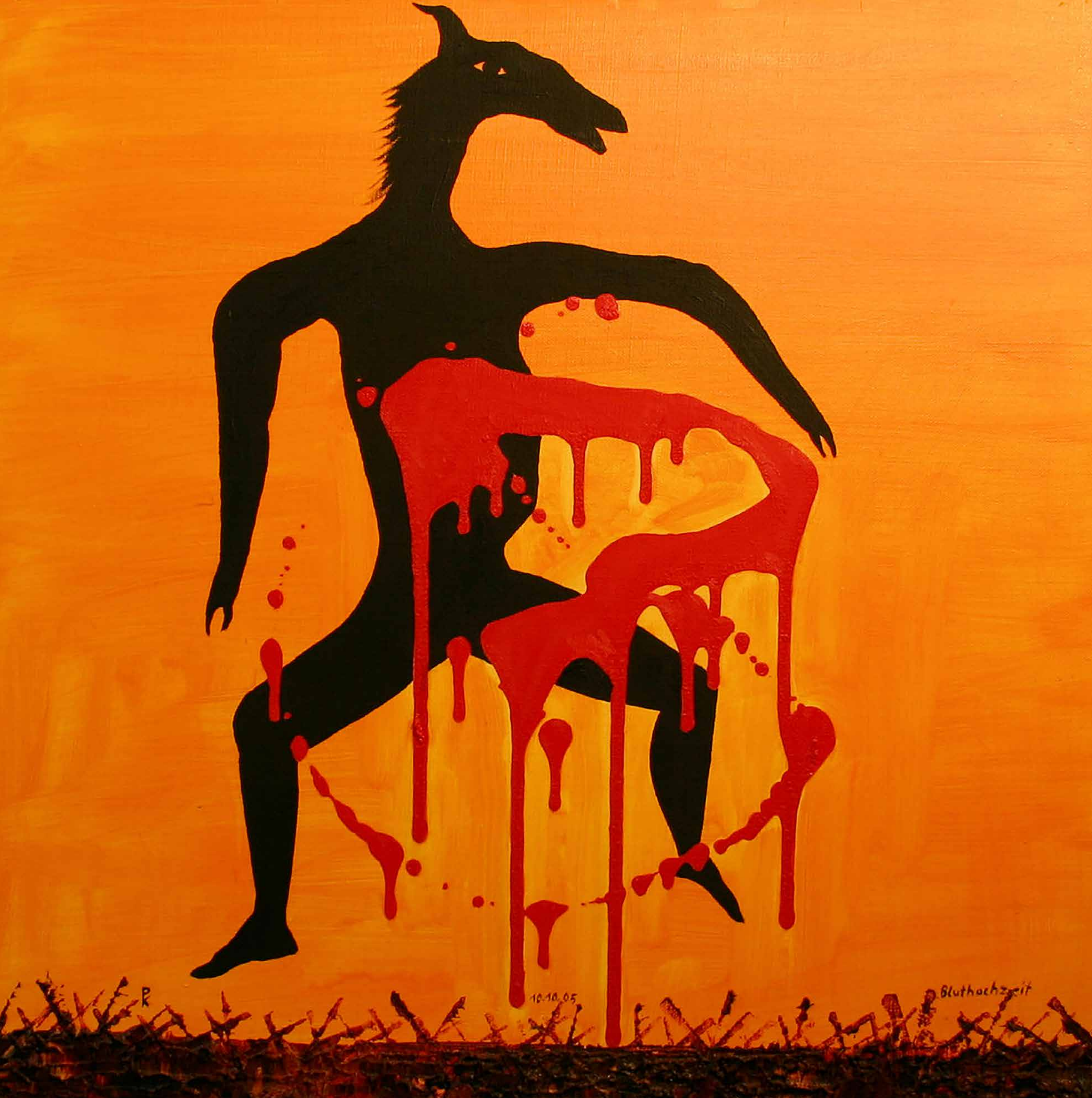
BLUTHOCHZEIT, 2005, Acryl und Öl auf Leinwand, 60 x 60 cm | Peter Kunkel Art | www.mhb-gruppe.de | Kunst in Ihren Räumen - Exklusive Kunst zum Mieten und Kaufen