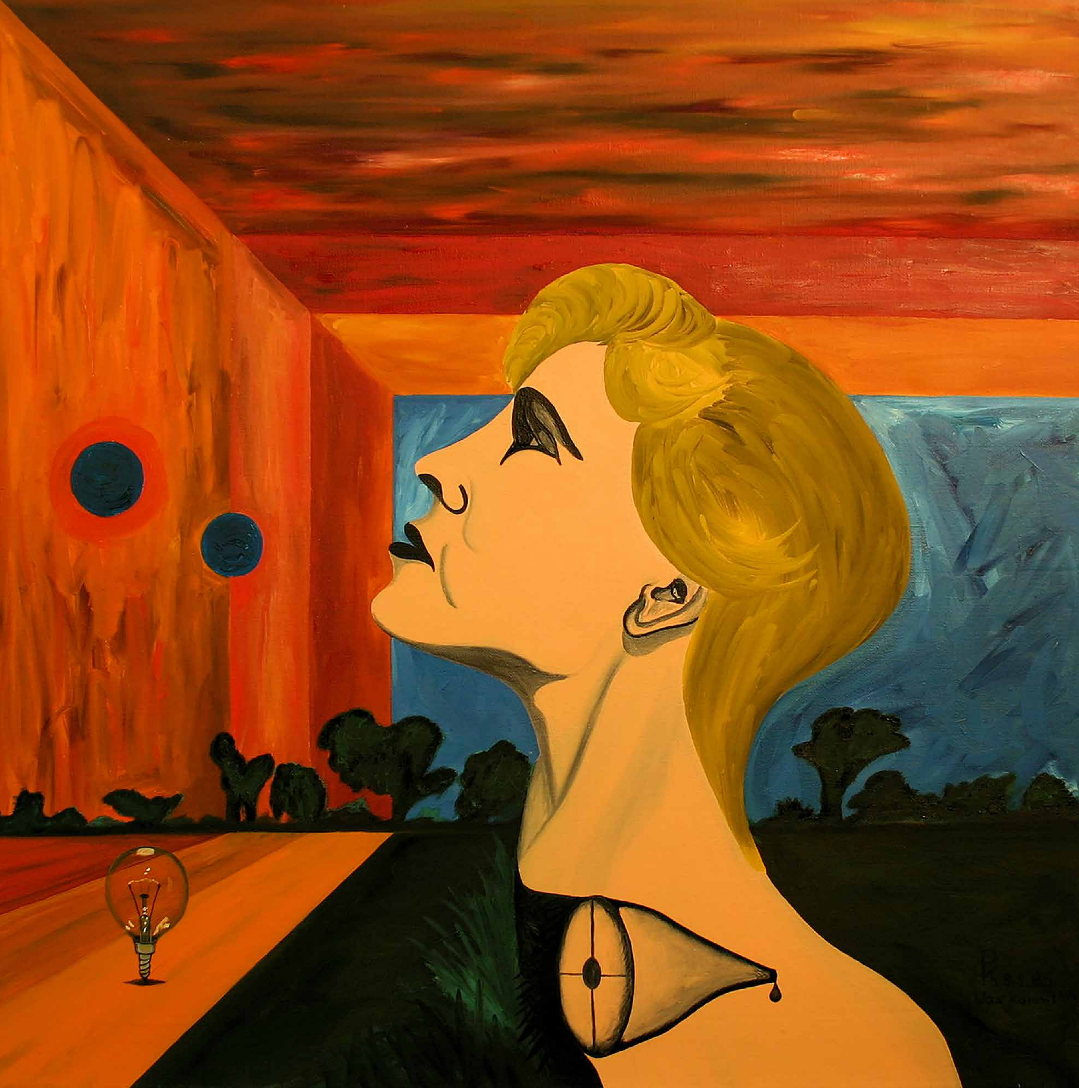
WAS KOMMT?, 1985, Öl auf Leinwand, 70 x 70 cm | Peter Kunkel Art | www.mhb-gruppe.de | Kunst in Ihren Räumen - Exklusive Kunst zum Mieten und Kaufen