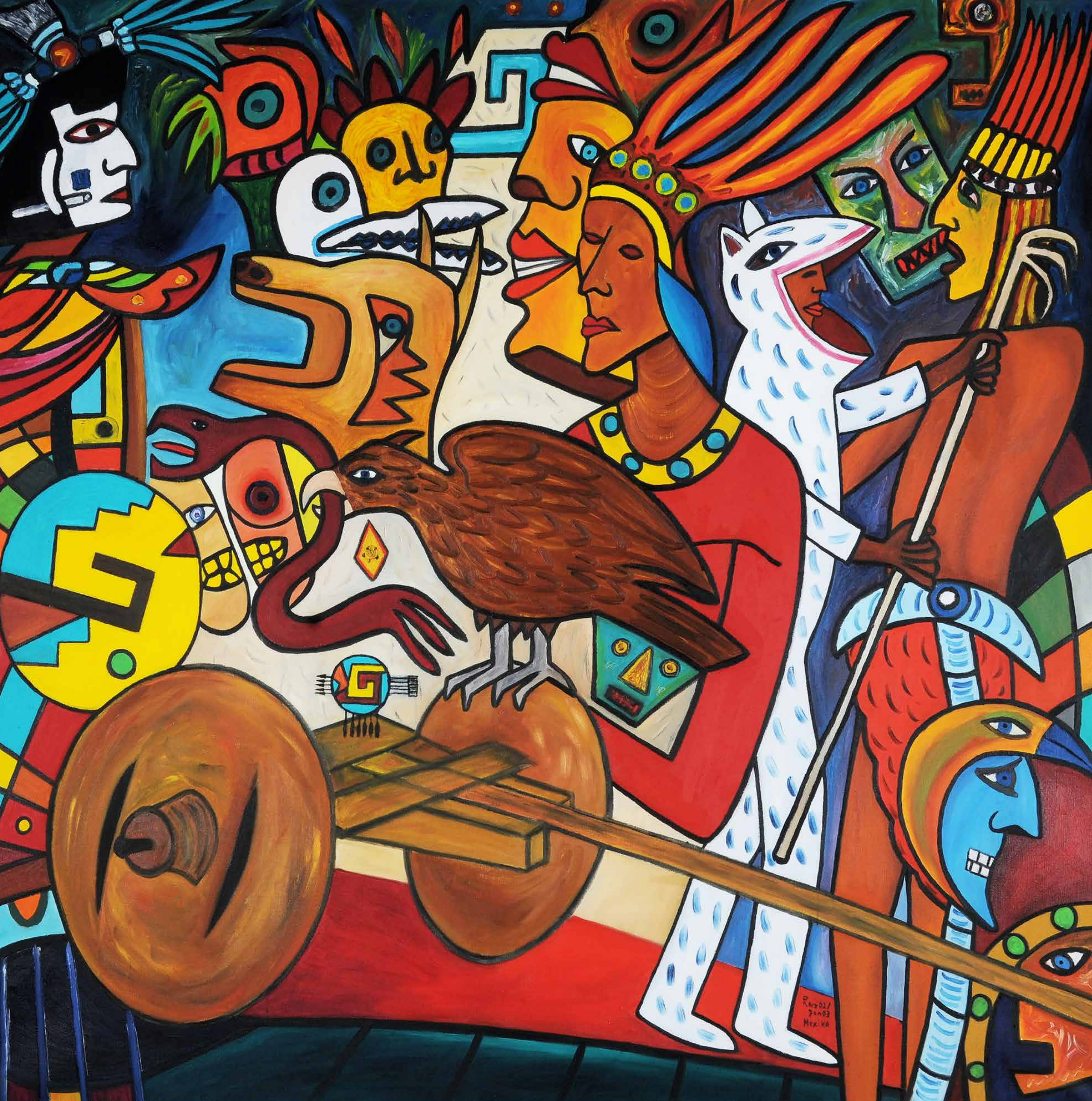
MEXICO_EINS, 2003, Öl auf Leinwand, 160 x 170 cm | Peter Kunkel Art | www.mhb-gruppe.de | Kunst in Ihren Räumen - Exklusive Kunst zum Mieten und Kaufen