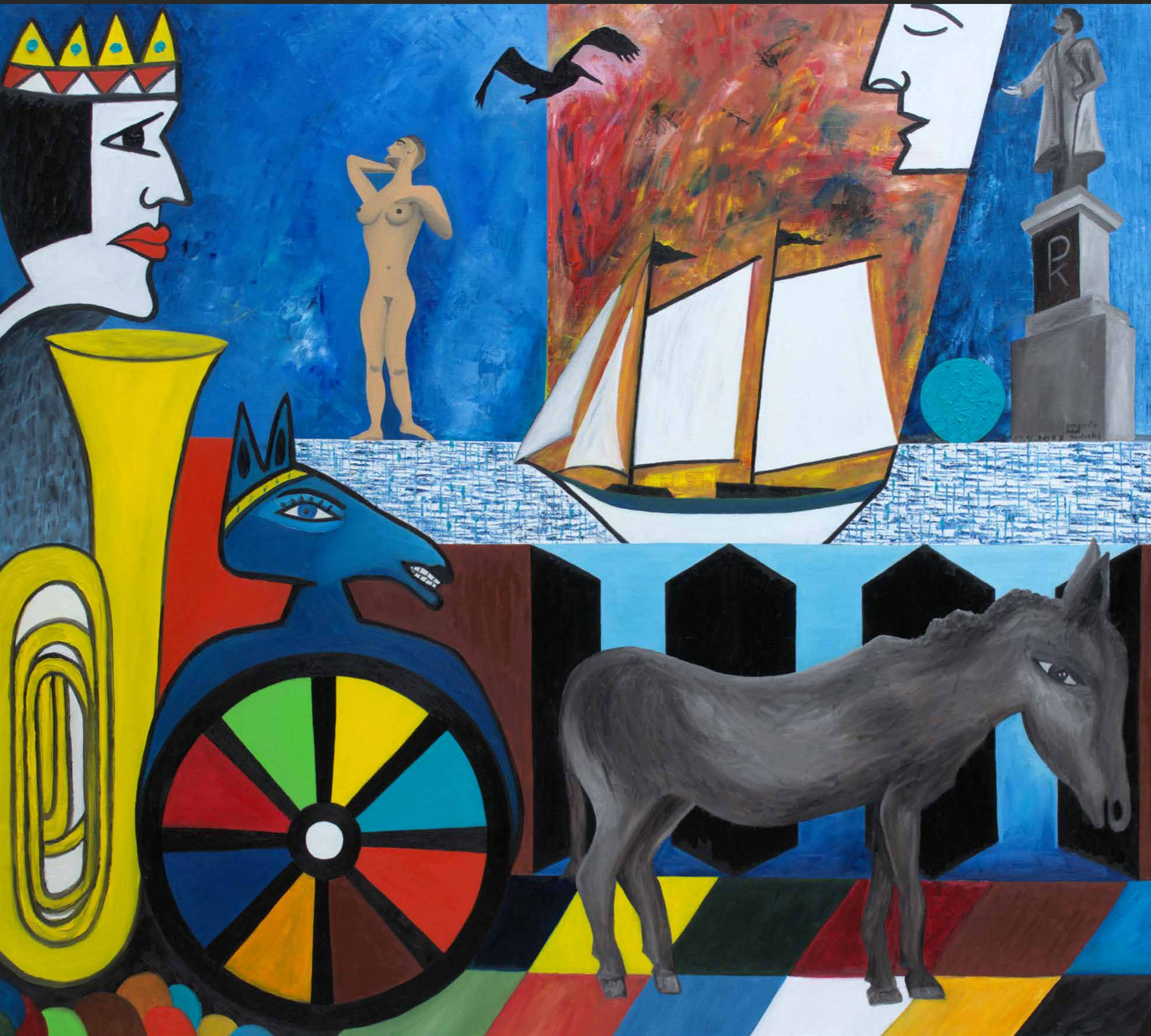
DAS GROßE RAD GEDREHT, 2017, Öl auf Leinwand, 160 x 180 cm | Peter Kunkel Art | www.mhb-gruppe.de | Kunst in Ihren Räumen - Exklusive Kunst zum Mieten und Kaufen