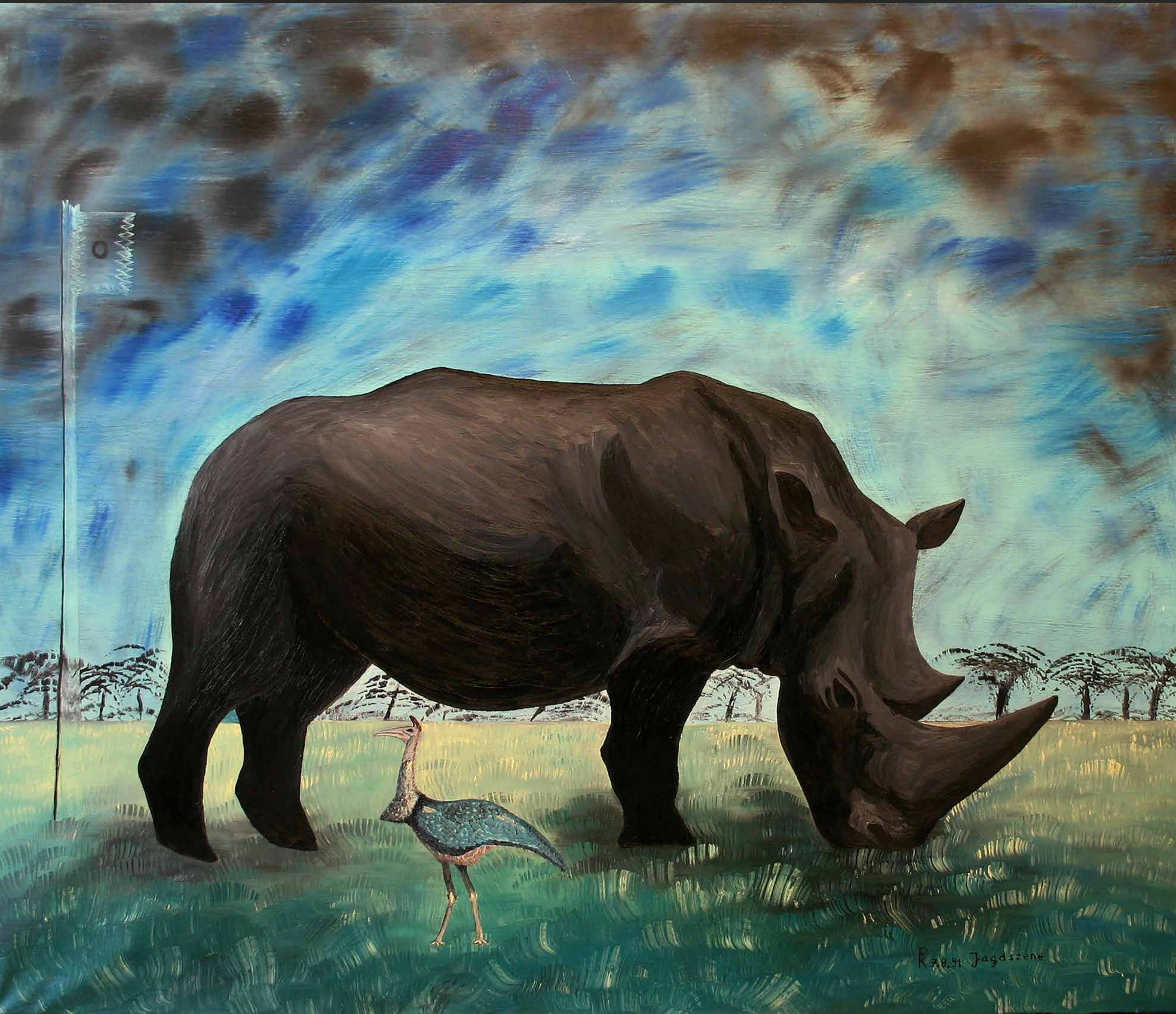
JAGDSZENE/ NASHORN, 1991, Öl auf Leinwand, 85 x 100 cm | Peter Kunkel Art | www.mhb-gruppe.de | Kunst in Ihren Räumen - Exklusive Kunst zum Mieten und Kaufen