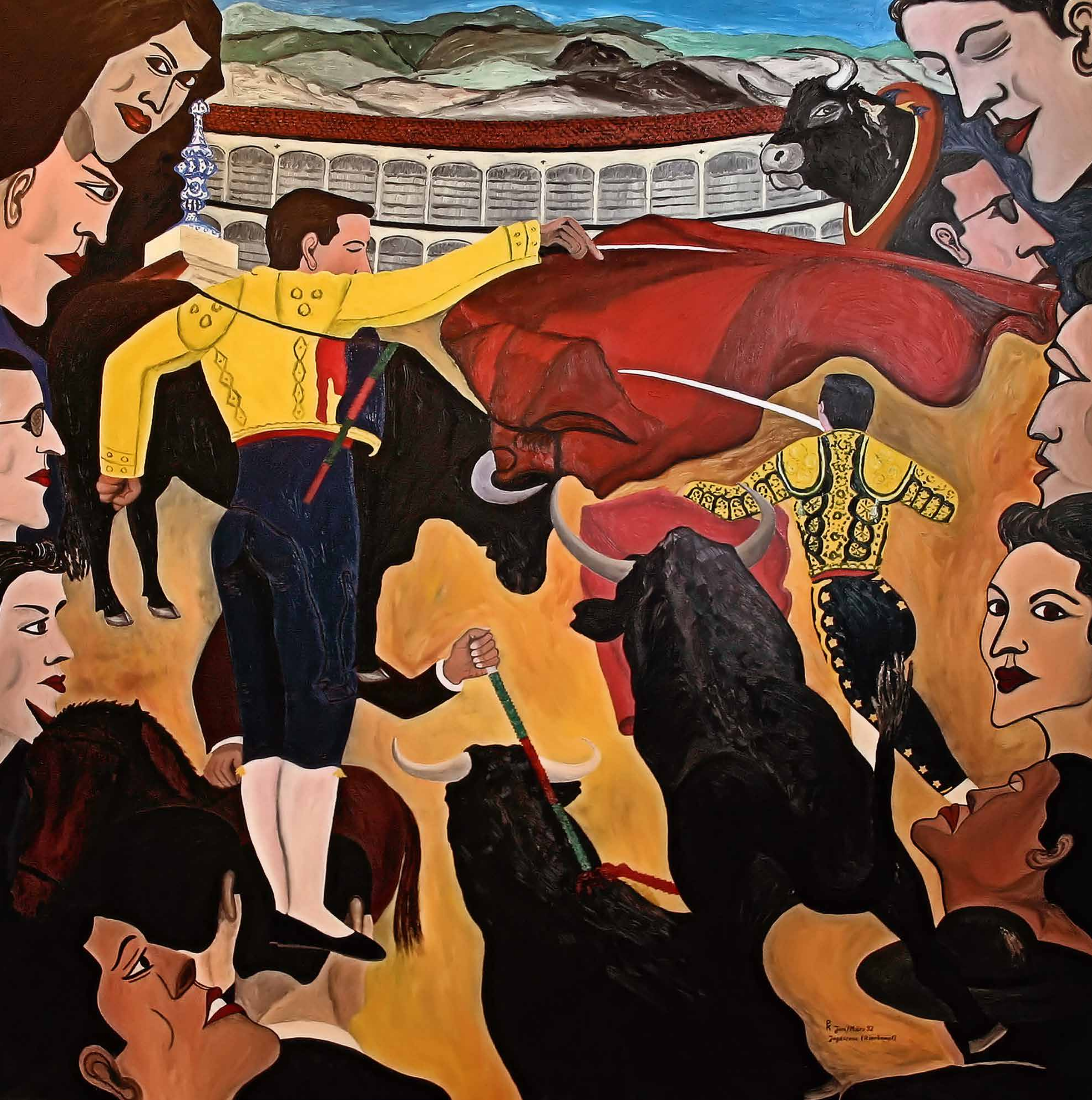
JAGDZENE_STIERKAMPF, 1992, Öl auf Leinwand, 170 x 170 cm | Peter Kunkel Art | www.mhb-gruppe.de | Kunst in Ihren Räumen - Exklusive Kunst zum Mieten und Kaufen