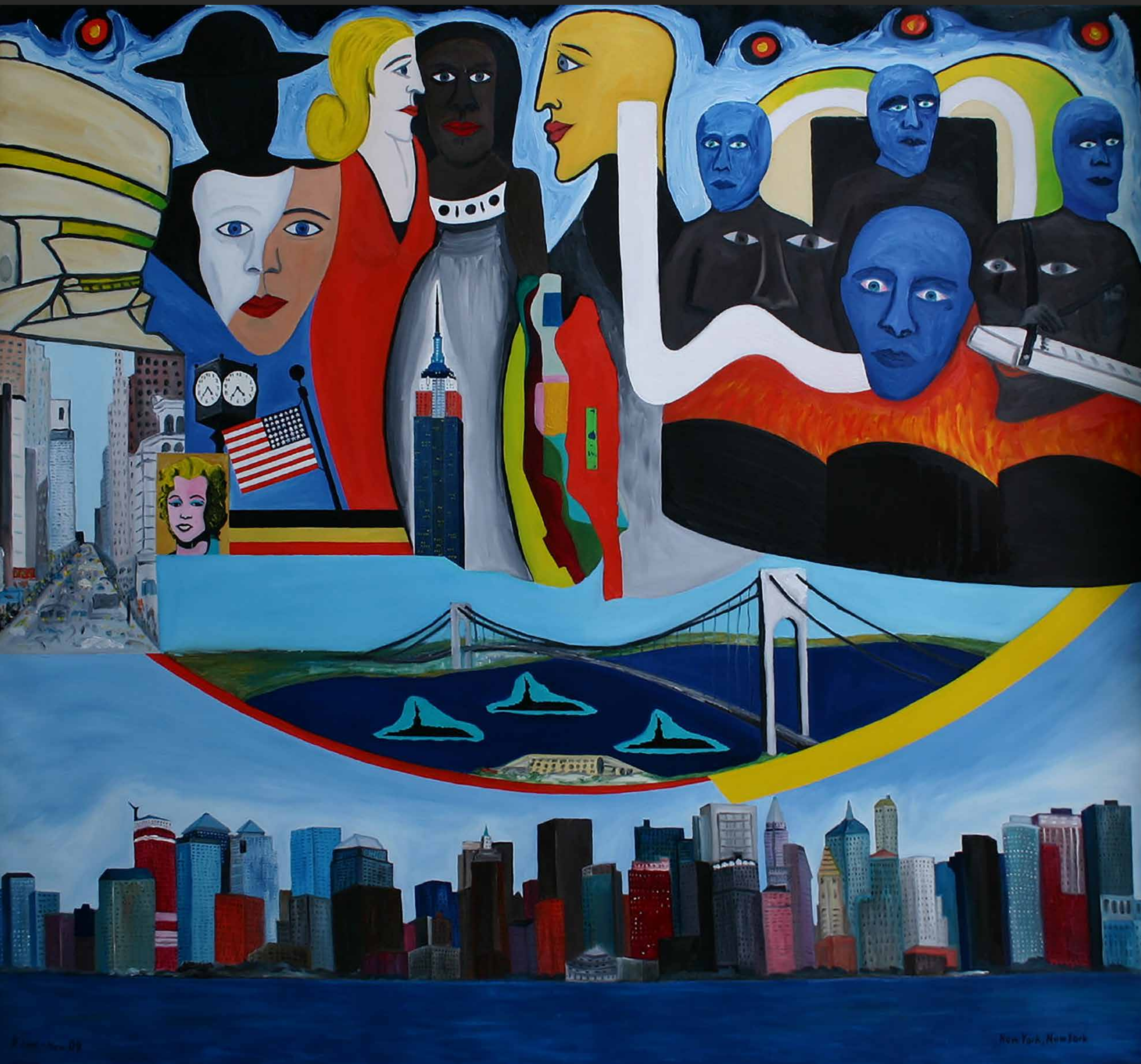
NEW YORK, NEW YORK, 2008, Öl auf Leinwand, 170 x 190 cm | Peter Kunkel Art | www.mhb-gruppe.de | Kunst in Ihren Räumen - Exklusive Kunst zum Mieten und Kaufen