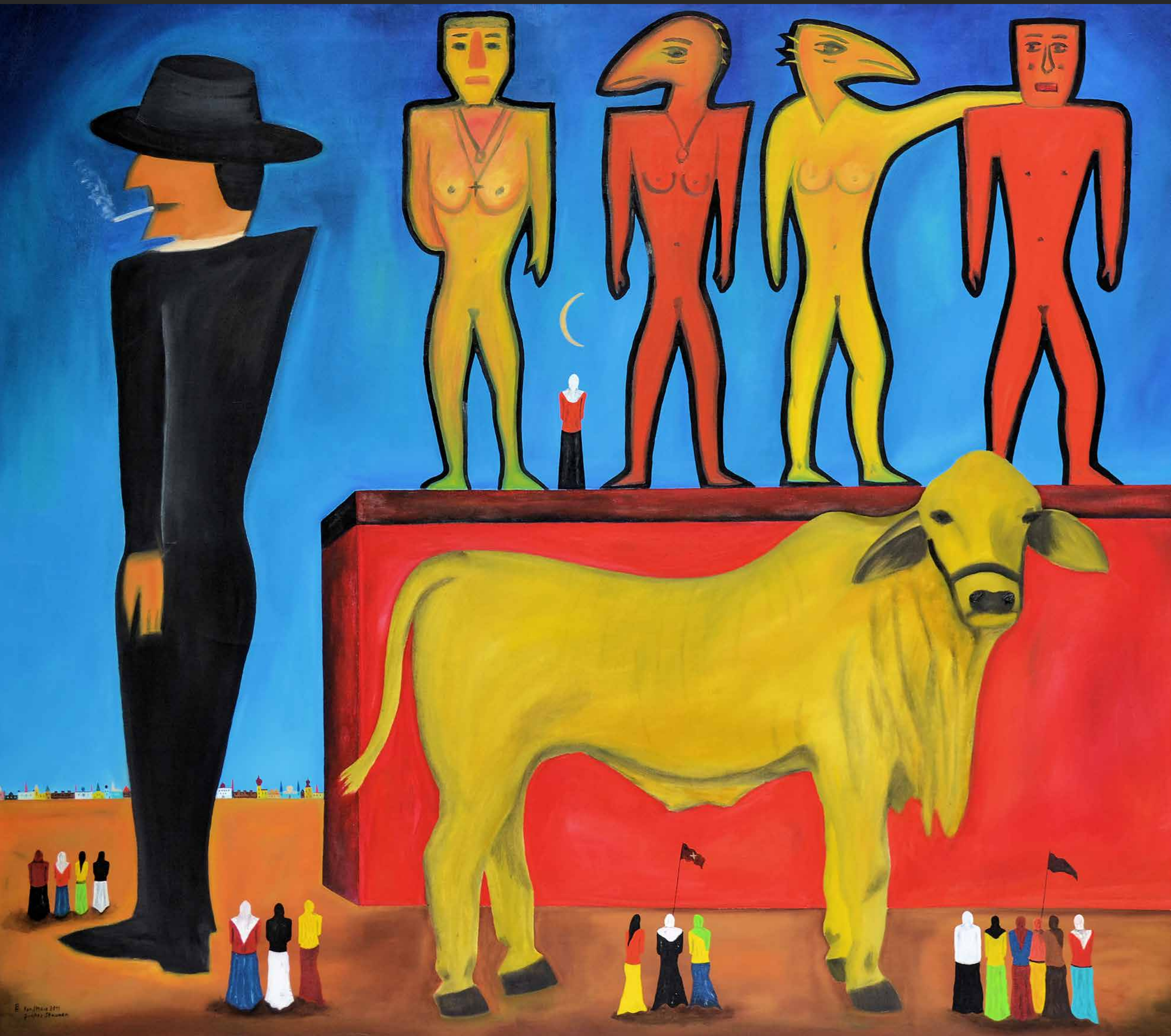
GROßES STAUNEN, 2011, Öl auf Leinwand, 150 x 170 cm | Peter Kunkel Art | www.mhb-gruppe.de | Kunst in Ihren Räumen - Exklusive Kunst zum Mieten und Kaufen